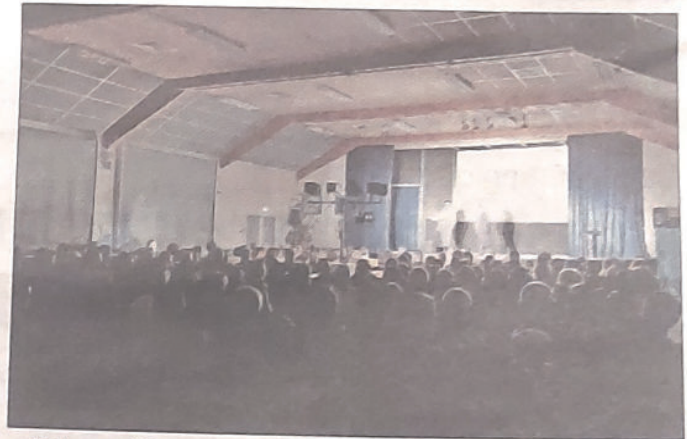
Salle comble pour la première représentation de la pièce.

À ces entretiens filmés s'ajoutent les répliques des deux comédiens. Les tirades oscillent entre des messages